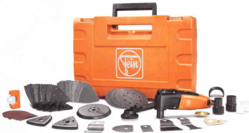
Die Elektrowerkzeugmanufaktur Fein erzielte mit einer Datenbankreorganisation bessere Antwortzeiten beim Archivierungssystem.

Datenbanken sind nur so gut wie ihre Antwortzeiten kurz sind. Um die Performance zugunsten schnellerer Zugriffszeiten zu verbessern, lagerte der international vertretene Elektrowerkzeughersteller Fein ältere Daten aus der SAP-Datenbank in das „Easy“-Archiv aus und führte anschließend eine Datenbankreorganisation durch. Federführendes Systemhaus in diesem etwa ein Jahr laufenden Projekt war der SAP-Partner Ass.Tec.