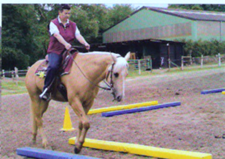
Wichtig beim Reiten: In der Kurve vor der Gasse stellen...

gelassen. Sie schlurft eher langsam weiter, erst als die Fahne gegen eine gelbe raschelnde Einkaufsstüte ausgetauscht wurde kam Leben in das Tier. Dasselbe Bild ergab sich beim Longieren und gleich darauf in den noch etwa einen Meter breit gelegten abwechselnd gelegten Gassen aus gelb-blauen Schläuchen und Pylonen. Wenn es in den Gassen einmal eng wurde, stieg Peppy auch ohne Zögern auf den Plastikschauch oder stieß die Hütchen um. Thies dazu: „Die Stute läuft nicht motiviert und fleißig, weil es ihr noch an Koordination und Balance fehlt. Das macht sie vor allem in Wendungen unsicher und sie wird langsamer. Das Training in den Dual-Gassen und häufiger Wechsel von der Geraden in die Biegung werden dieses Problem verbessern.“