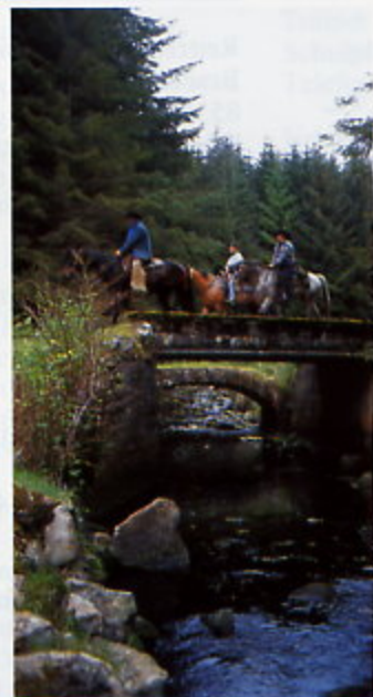
Fast wie in den Rocky Mountains.