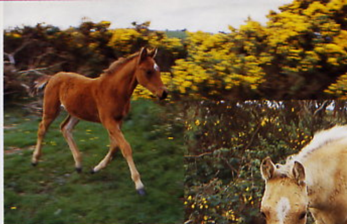
Auch für geeignete Nachzucht ist gesorgt.